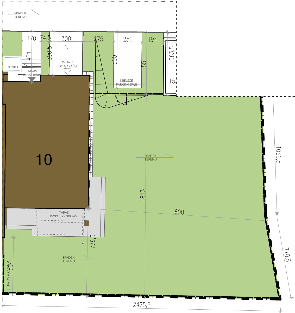
PLAN OSIEDLA | JAKUBOWICE